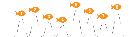
8 naudingų omega-3 riebalų rūgščių koncentratas. Patikrinta, kad nepatektų tokių kenksmingų medžiagų, kaip gyvsidabris ir švinas.